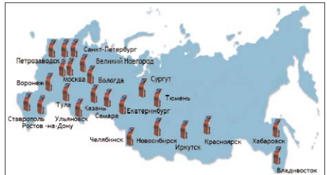
Рис. 1. Ревматологические центры Российской Федерации, в которых были установлены терминалы самооценки для пациентов с РА

В работе принимали участие ревматологи из 21 ревматологического центра, оснащенного терминалами (рис. 1).